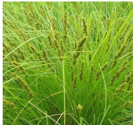
Juncia de zorro