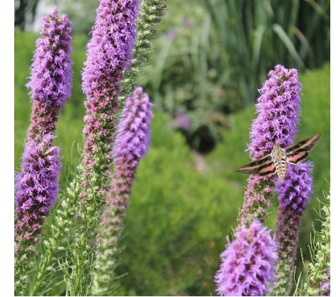
Pluma de la pradera