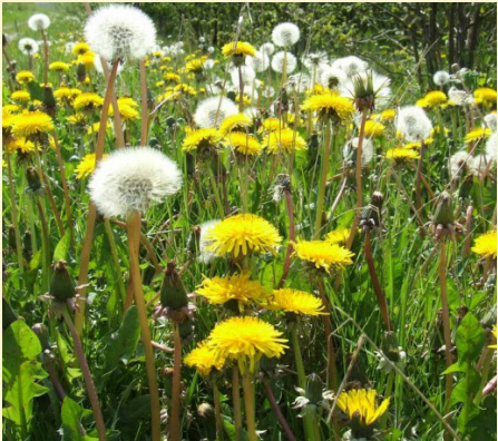
Diente de león