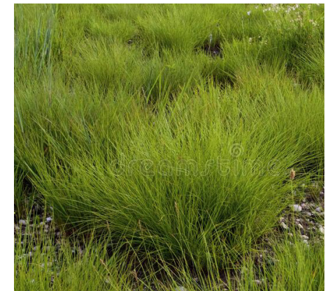
Semilla de pradera