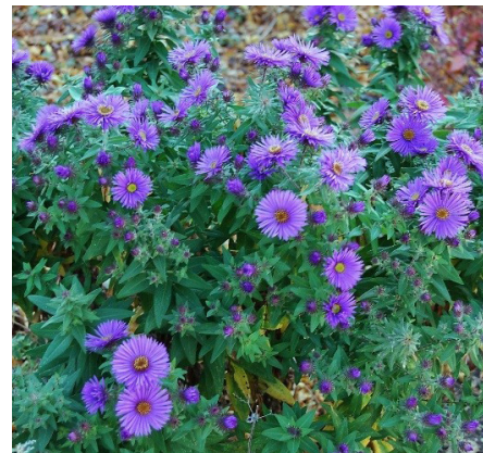
Aster de Nueva Inglaterra