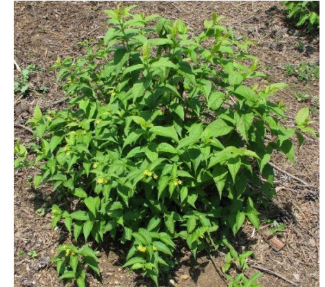
Madreselva arbustiva del norte