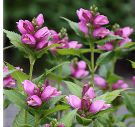
Cabeza de tortuga