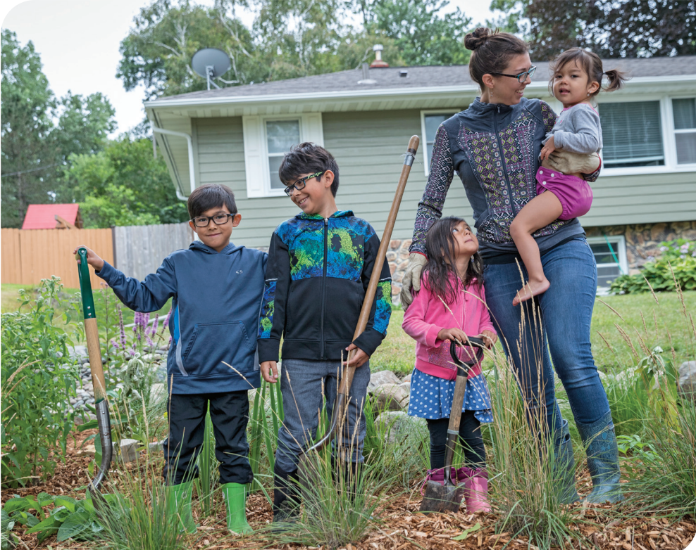
တာ်အိၣ်ဆိးလီၢ်အမ့ၢ်စ့ဆိၣ်ထွဲထံကရၢၢ်, စ့ဆိၣ်ထွဲထံကဆိၣ်တာ်တိၣ်ကျဲၤ.