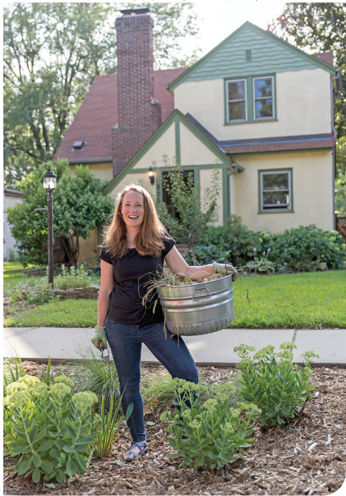
အဖိလဲၣ်တပၤ- တၢ်အိၣ်ဆိးလီၢ်အမူခိၣ်စ့ထံကရၢၢ်, စ့ဆိၣ်ထွဲထံကဆိၣ်တၢ်တိၣ်ကျဲၤ.